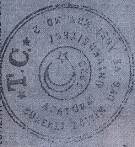
YAŞAM BOYU EĞİTİMİ DESTEKLEME DERNEĞİ BAŞKANI

İşbu protokol 10 (on) maddeden ibaret olup, ATASEM ile YBEDD tarafından okunup anlaşıldıktan sonra 28/02/2013 tarihinde 2 (iki) nüsha olarak tanzim edilerek imza altına alınmıştır.